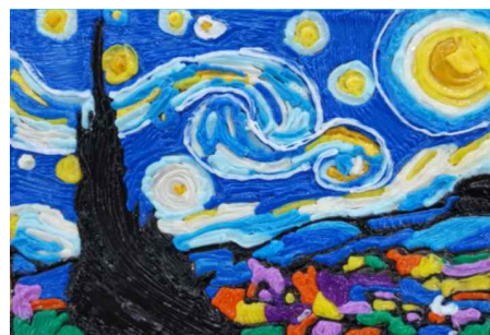
<명화 작품 표현하기>