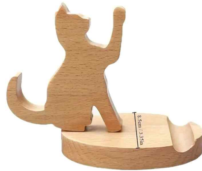
<휴대폰거치대 및 받침대>