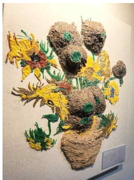
<다양한 명화 작품>