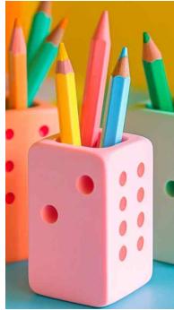
<주사위 모양 연필통>