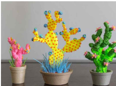
<선인장 만들어 심기>